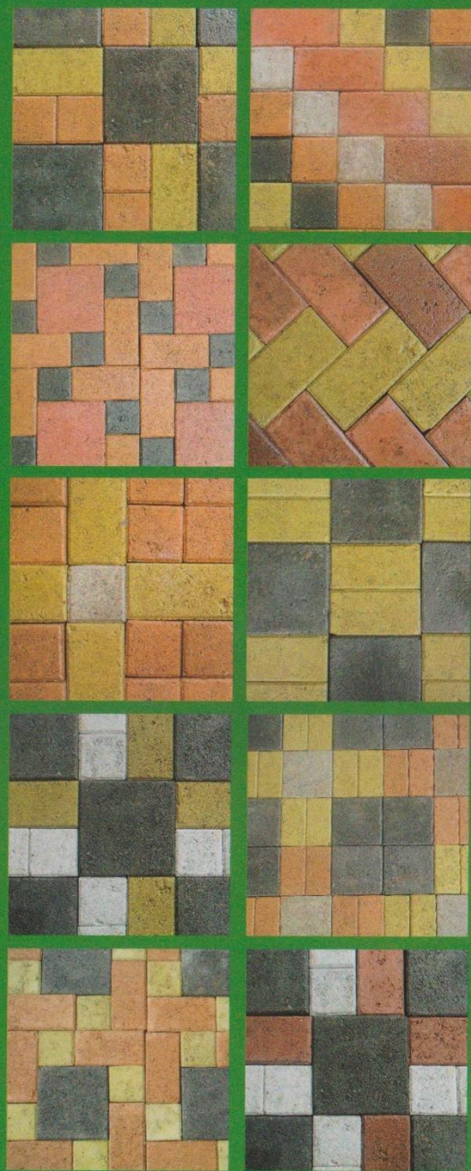
Aplicaciones con adoquines