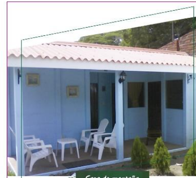
Casa de montaña