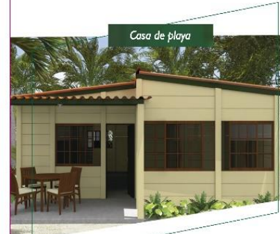
Casa de playa

¡Queremos iniciar un nuevo proyecto contigo!