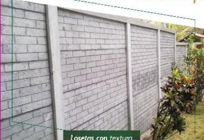
Losetas con textura

Tapial a base de Losetas Sisadas y Columnas de concreto armado, colocadas a 2.00 mt, 1.50 mt y a 1.00 mt a eje.